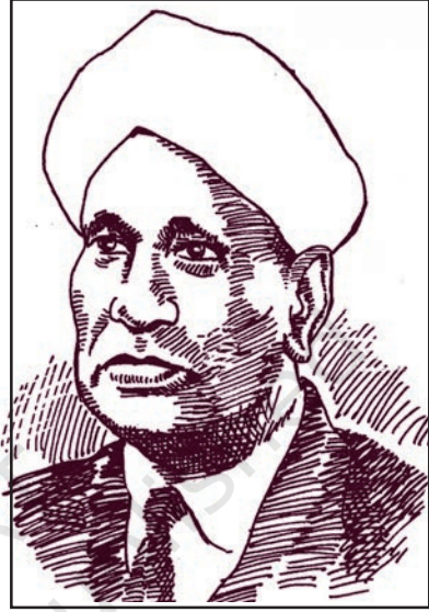
सर चंद्रशेखर वेंकट रामन्

रामन् का मस्तिष्क विज्ञान के रहस्यों को सुलझाने के लिए बचपन से ही बेचैन रहता था। अपने कॉलेज के जमाने से ही उन्होंने शोधकार्यों में दिलचस्पी लेना शुरू कर दिया था। उनका पहला शोधपत्र फिलासॉफिकल मैगजीन में प्रकाशित हुआ था। उनकी दिली इच्छा तो यही थी कि वे अपना सारा जीवन शोधकार्यों को ही समर्पित कर दें, मगर उन दिनों शोधकार्य को पूरे समय के कैरियर के रूप में अपनाने की कोई खास व्यवस्था नहीं थी। प्रतिभावान छात्र सरकारी नौकरी की ओर आकर्षित होते थे। रामन् भी अपने समय के अन्य सुयोग्य छात्रों की भाँति भारत सरकार के वित्त-विभाग में अफ़सर बन गए। उनकी तैनाती कलकत्ता* में हुई।